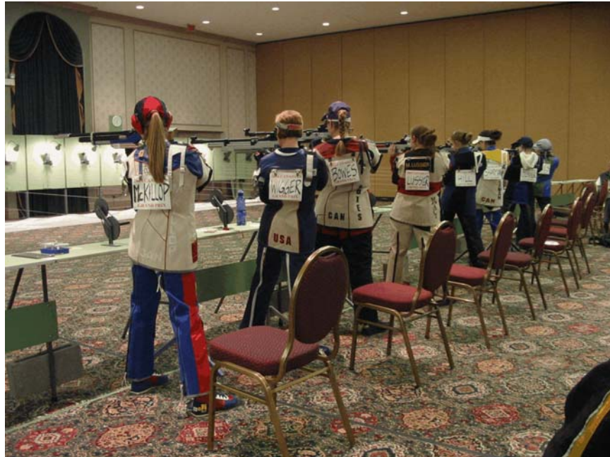
Grand Prix - 2004

Travaillant entre et autour des débats, les participants tireront entre deux et quatre séries finale. Les cibles seront marquées, annoncées et projetées sur écran pour créer une sensation réelle. Cette clinique est limitée à 16 athlètes à carabine et 16 athlètes aux pistolets, et le coût est 20$.