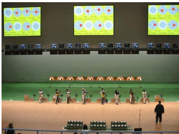
Athens - 2004