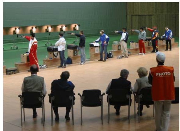
Athens - 2004